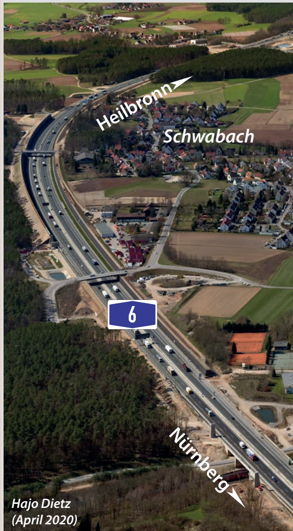
Hajo Dietz (April 2020)