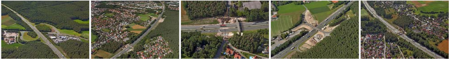
Juli 2016 Juli 2016 Juli 2016 Juli 2016 Juli 2016