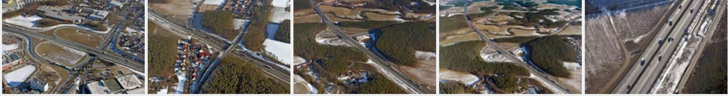
Januar 2017 Januar 2017 Januar 2017 Januar 2017 Januar 2017