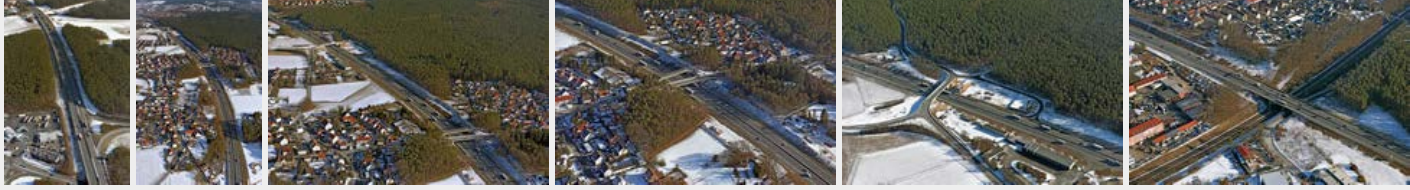
Januar 2017 Januar 2017 Januar 2017 Januar 2017 Januar 2017 Januar 2017