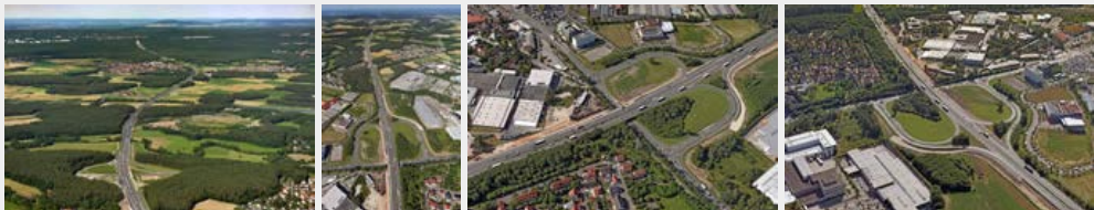
Juli 2016 Juli 2016 Juli 2016 Juli 2016

Autobahndirektion Nordbayern Flaschenhofstraße 55 90402 Nürnberg Kontaktformular