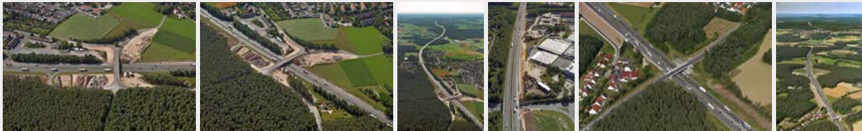
Juli 2016 Juli 2016 Juli 2016 Juli 2016 Juli 2016 Juli 2016