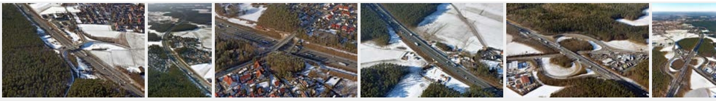
Januar 2017 Januar 2017 Januar 2017 Januar 2017 Januar 2017 Januar 2017