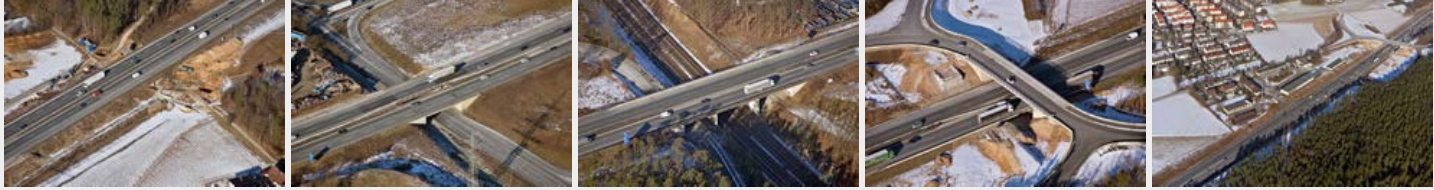
Januar 2017 Januar 2017 Januar 2017 Januar 2017 Januar 2017