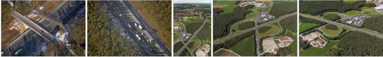
Januar 2017 Januar 2017 Juli 2016 Juli 2016 Juli 2016