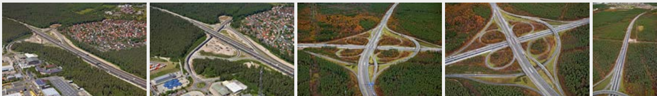
Juni 2017 Juni 2017 November 2016 November 2016 November 2016