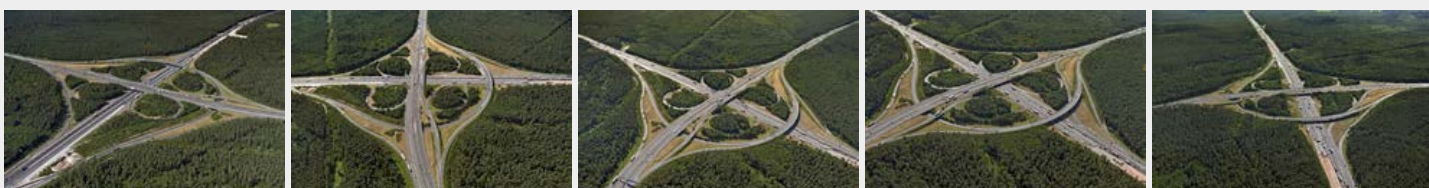
Juli 2016 Juli 2016 Juli 2016 Juli 2016 Juli 2016