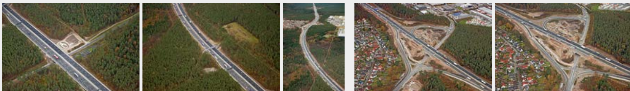
November 2016 November 2016 November 2016 November 2016 November 2016