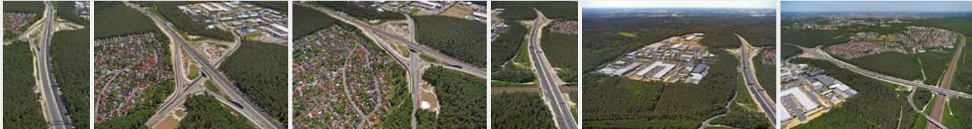
Juni 2017 Juni 2017 Juni 2017 Juni 2017 Juni 2017 Juni 2017