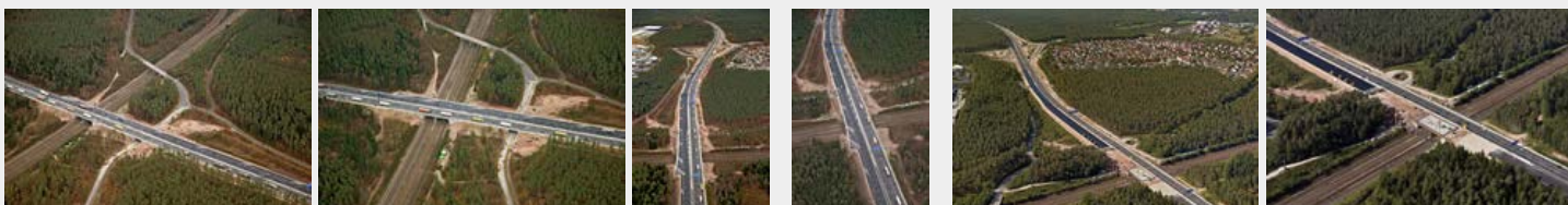
November 2016 November 2016 November 2016 November 2016 September 2016 September 2016