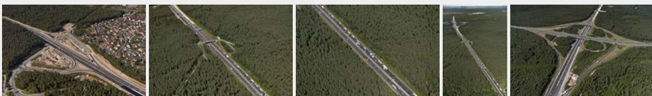
September 2016 Juli 2016 Juli 2016 Juli 2016 Juli 2016