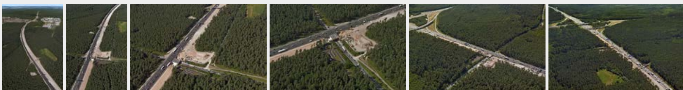
Juli 2016 Juli 2016 Juli 2016 Juli 2016 Juli 2016 Juli 2016