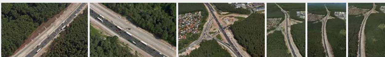
Juli 2016 Juli 2016 Juli 2016 Juli 2016 Juli 2016 Juli 2016