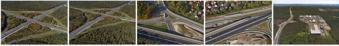
Okt 2017 Okt 2017 Okt 2017 Okt 2017 Juni 2017