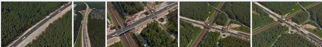
Juli 2016 Juli 2016 Juli 2016 Juli 2016 Juli 2016